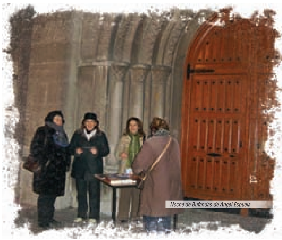
Noche de Bufandas de Angel Espuela

Entonces me dice el señor de Sevilla, espera que te ayudo a meter la mesa para que no te mojes, pues tú puedes estar dentro de la iglesia. Dicho y hecho.