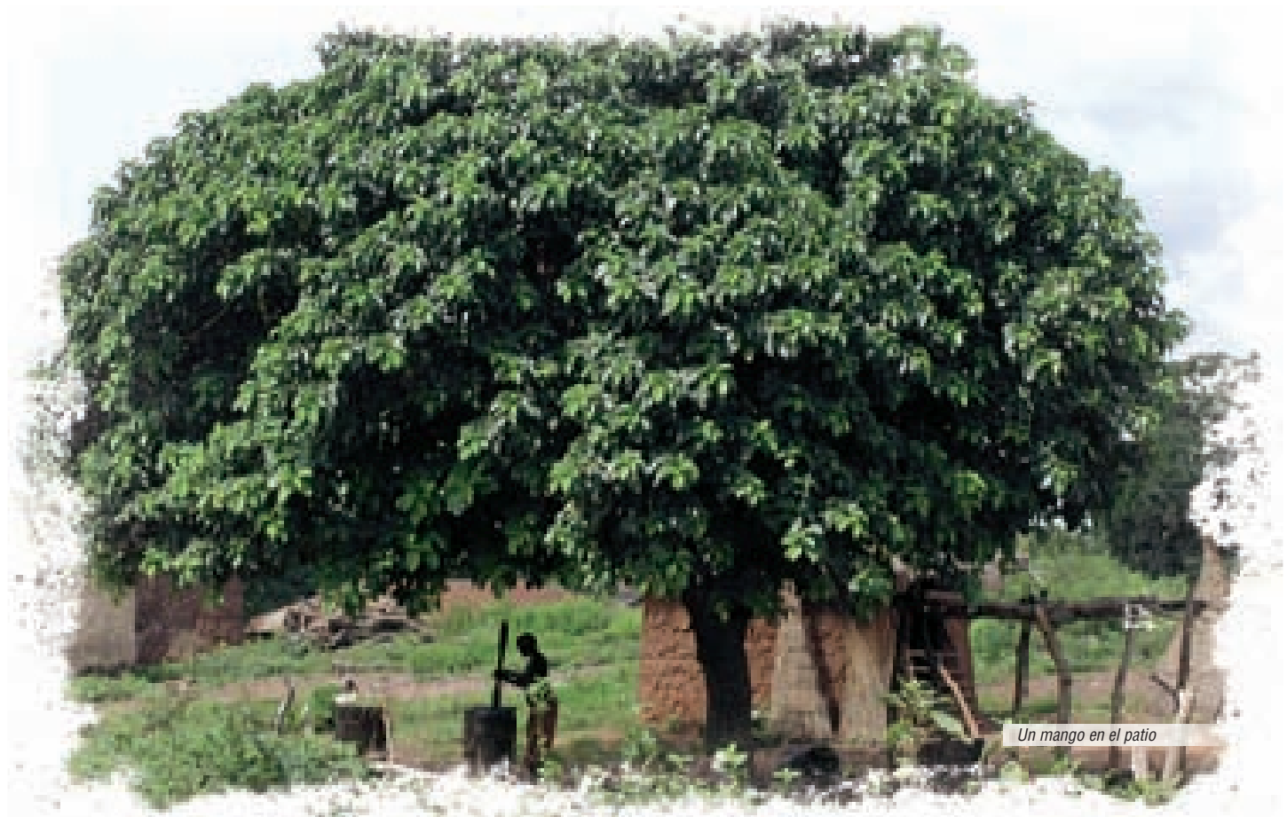
Un mango en el patio

Cuento bariba recogido por Paolo Valente