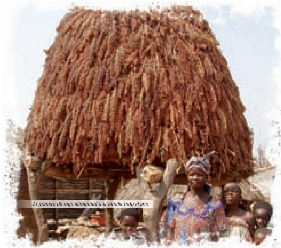
El granero de mijo alimentará a la familia todo el año

Las religiosas siguen documentándose para encontrar nuevas recetas susceptibles de interesar a los paladares de la gente de Nikki.