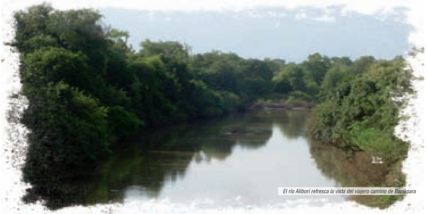
El río Alibori refresca la vista del viajero camino de Banikoara

Yo me encargo de la coordinación: buscar profesores, temario, horarios, el día a día y todo lo que va surgiendo en la convivencia, pues viven en régimen interno. Son diez y comienzan con mucho ánimo. La mayoría tiene problemas para leer y escribir, son campesinos y no están acostumbrados a las letras, aunque ya se ven los progresos.