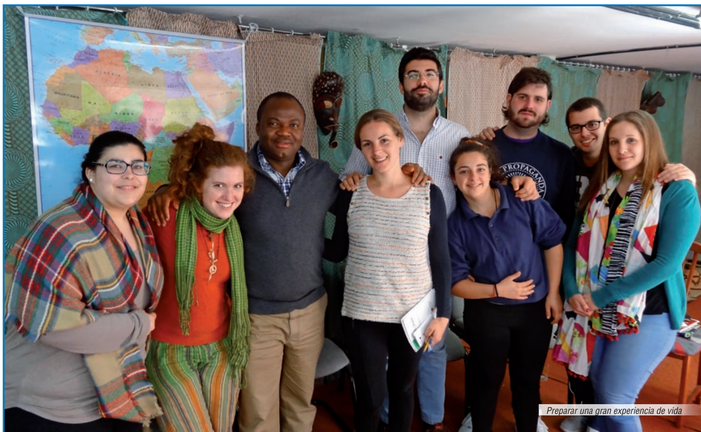
Preparar una gran experiencia de vida