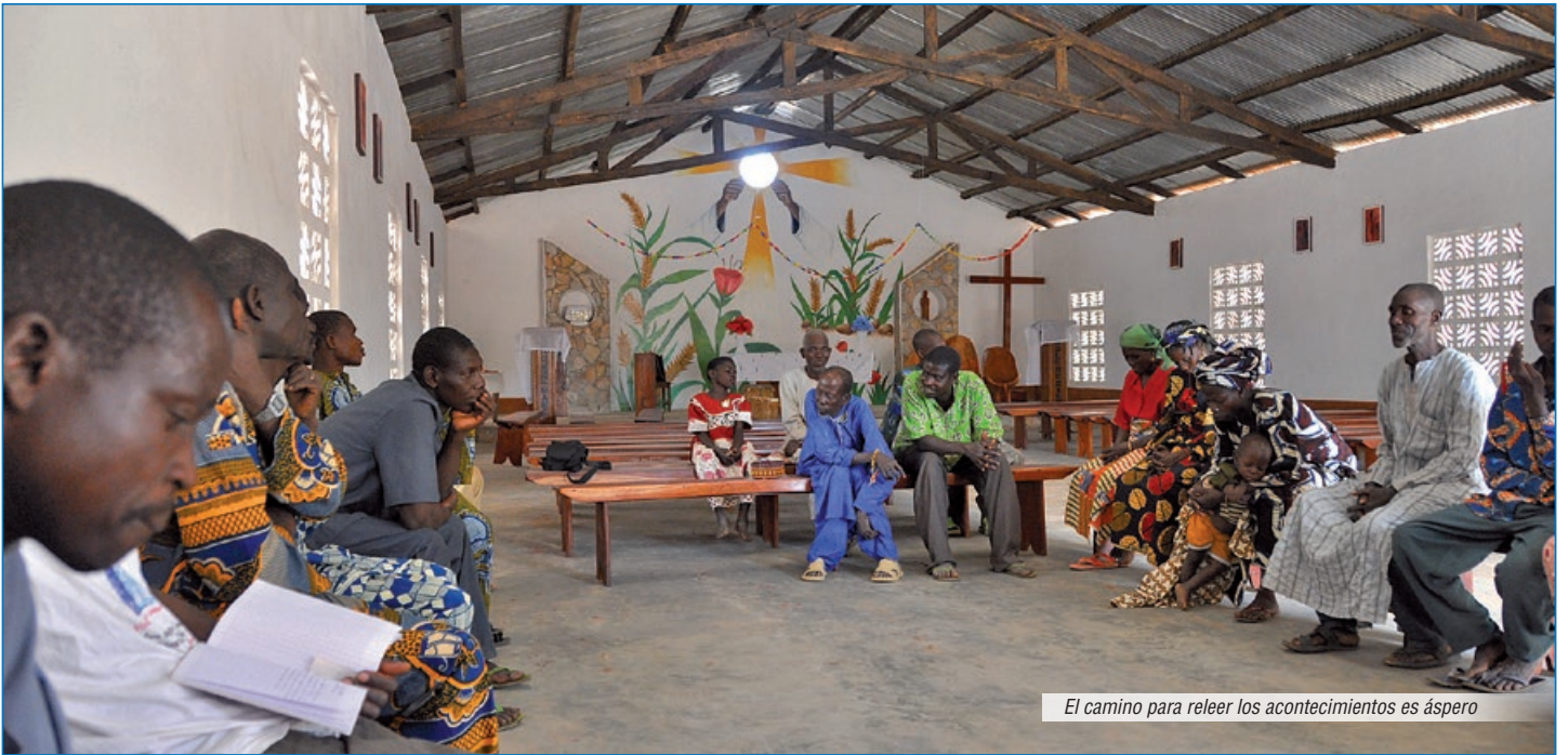
El camino para releer los acontecimientos es áspero