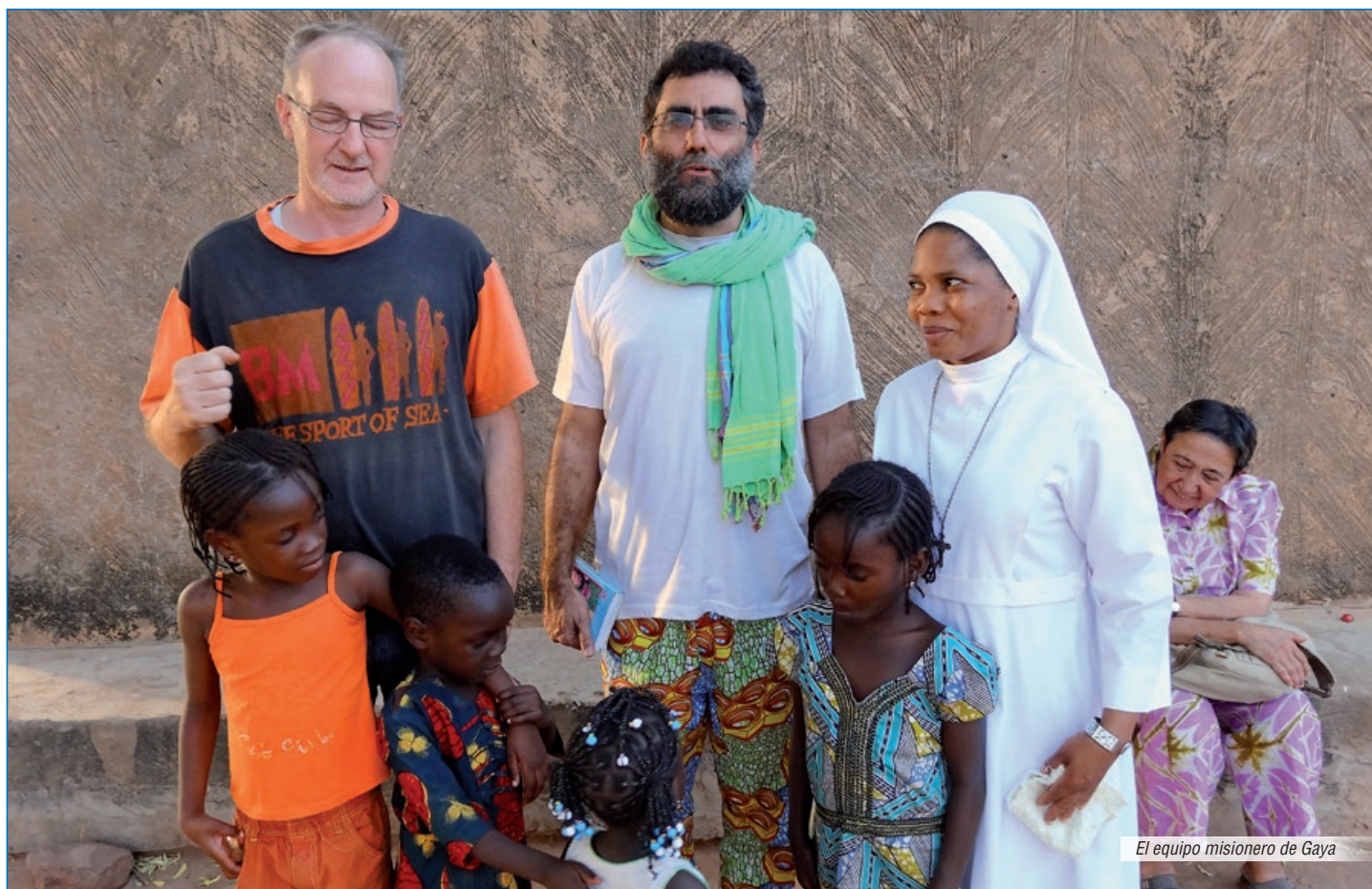
El equipo misionero de Gaya